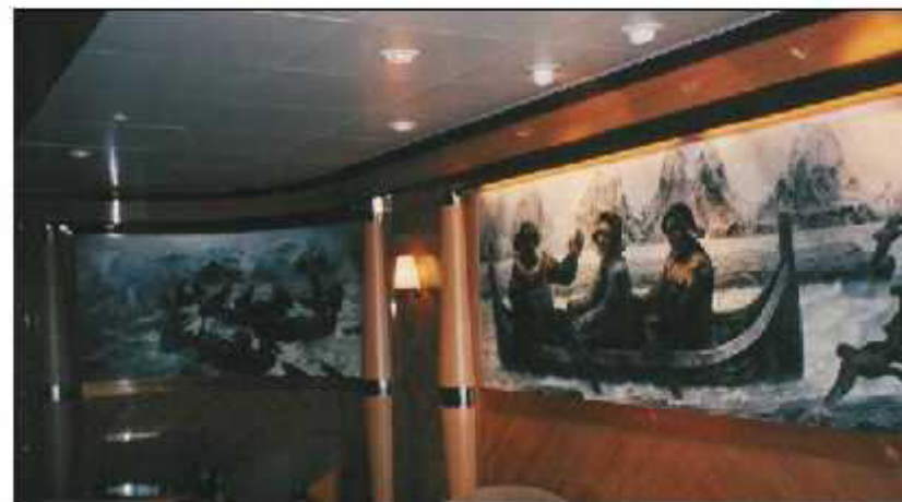
Kaare Espolin Johnson's malerier fra MS Harald Jarl.