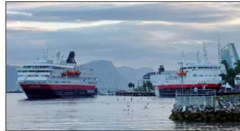
Sommerstid møtes ofte nord- og sydgående ved kai i Molde.