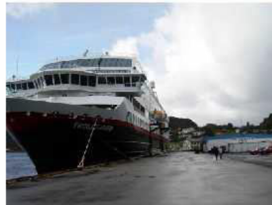
MS Trollfjord ved kai i Torvik.