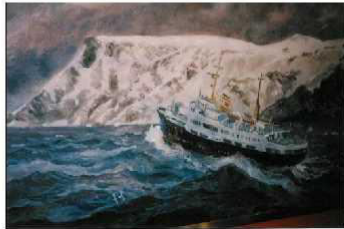
Hurtigrute i vintervær.