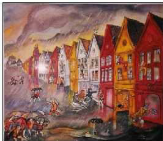
Bryggen Bergen i ruskevær.